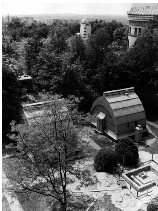
2. ábra A potsdami GeoForschungsZentrum .

sze. A most már potsdami kezdőpontú rendszert 1940-ig egységesítették, és a létrejött rendszer korabeli elnevezése Reichsdreiecksnetz 1940 (RDN-1940) lett. A második világháború során a rendszert a Nagynémet Birodalomba újonnan annektált területeken is bevezették (RMI, 1944). Amint azt a jelen munka során elvégzett, és alább bemutatott számítások igazolják, arra is törekedtek, hogy a rendszert ne csak a német katonai vagy